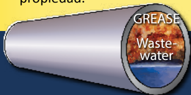
Las grasas son una de las causas principales de obstrucciones y desbordes en las alcantarillas de drenaje sanitario.

Las grasas y aceites que se desechan en los desagües pueden causar muchos problemas en las tuberías de drenaje sanitario y en sus laterales. Las grasas se acumulan en las paredes de la tubería y pueden causar obstrucciones, resultando en desbordes en los drenajes sanitarios e inundaciones de aguas negras en su propiedad.