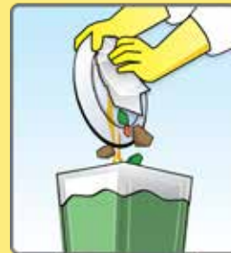
Vierta comida de alto contenido grasoso en la basura y no en el triturador de basura.

El Programa de Grasas y Aceites no solamente protege los alcantarillados, es la ley del Condado de Prince William.